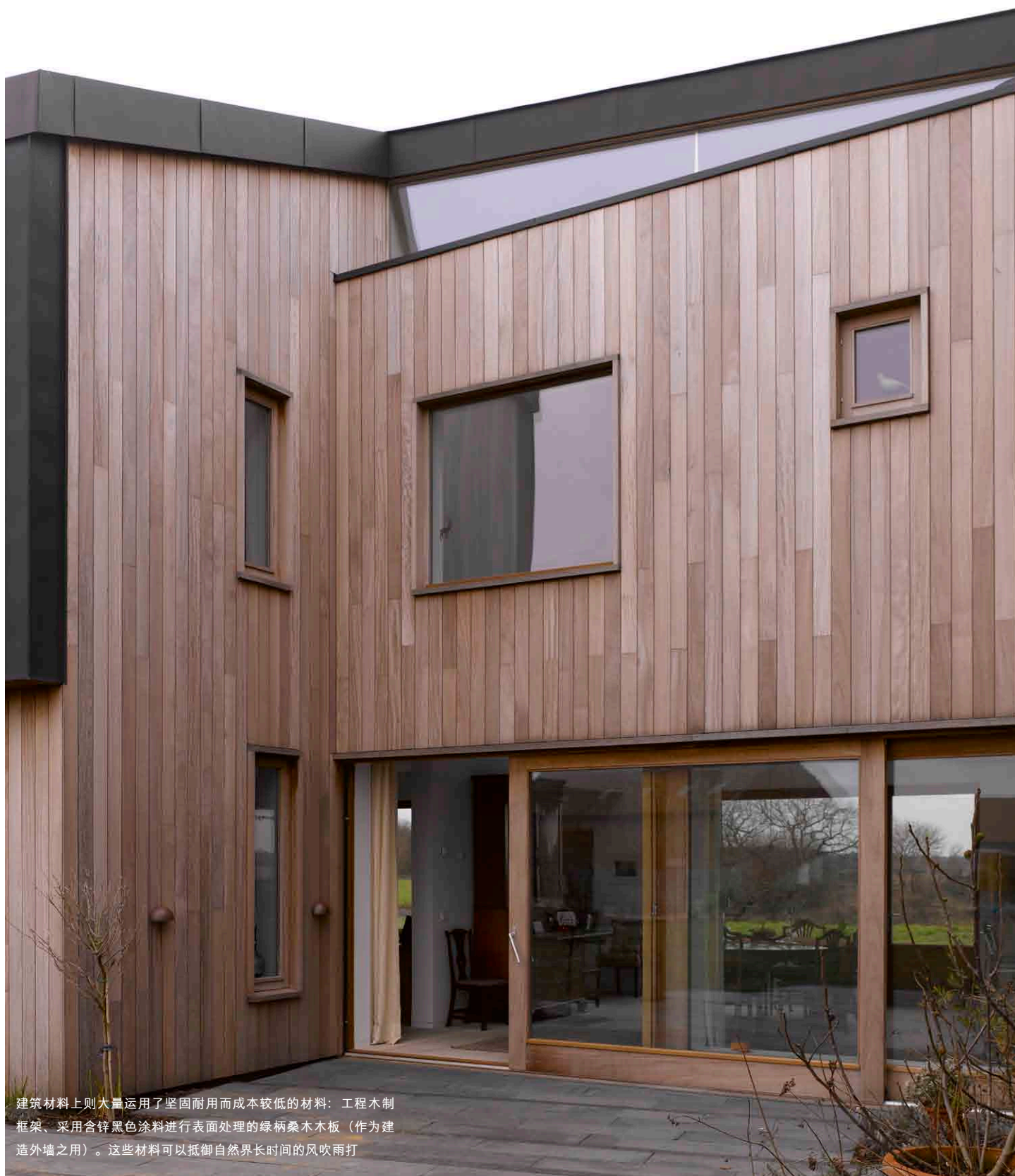
建筑材料上则大量运用了坚固耐用而成本较低的材料：工程木制框架、采用含锌黑色涂料进行表面处理的绿柄桑木木板（作为建造外墙之用）。这些材料可以抵御自然界长时间的风吹雨打